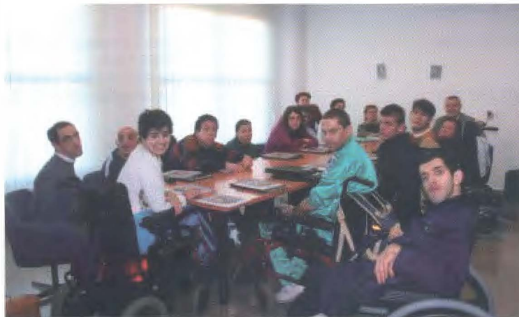
Asistentes al programa de Educación afectivo sexual

Se plantea la posibilidad de que las personas más cercanas a los usuarios sean informadas y se analice conjuntamente las situaciones, emociones que lleven a cabo y se organice una reunión con ellos al final de este curso. Durante el desarrollo del curso se hizo entrega a los alumnos de la publicación Función sexual y vivencia de la sexualidad tras una lesión medular que los laboratorios Pfizer habían donado a tal fin y del libro de Sexo en la pareja de uno de los técnicos que desarrollan el programa.